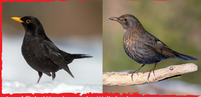
Amsel (links Männchen, rechts Weibchen)